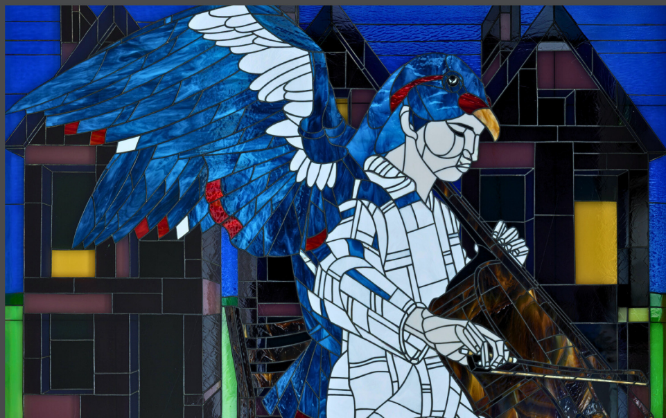
Vitrail créé par Jean Beaulieu